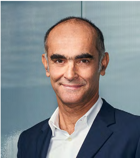
Gilles Andrier Präsident des Verwaltungsrats