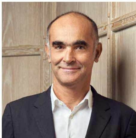
جيل أندريه الرئيس التنفيذي

تلتزم شركة جيفودان بتوفير جميع المواد والخدمات بطريقة تحمي الناس والبيئة بحلول عام 2030. وبصفتنا شركة رائدة في الصناعة تتمتع بخبرة 250 عامًا، فإننا نعمل بالشراكة مع المنتجين والموردين لتحويل طريقة حصولنا على المواد وخلق قيمة جديدة يتقاسمها الجميع. ويستند نهجنا إلى هدفنا: "خلق حياة أكثر سعادة وصحة مع حب الطبيعة. دعونا نخيل معًا!" وعلى وجه الخصوص، ضمان استفادة جميع أصحاب المصلحة من العمل معنا، وإظهار حبنا للطبيعة في كل